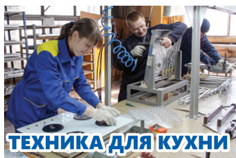
ТЕХНИКА ДЛЯ КУХНИ

В день весны и труда сотрудники пензенских предприятий по традиции встретятся, чтобы вместе пройти по знакомым улицам города. Традиция, заложенная не нами, до сих пор жива. В первые дни мая родная Пенза особенно хороша, и пройти по ней дружными рядами приятно. Пусть небо над нами всегда будет мирным, а труд — благодатным. С наступающими праздниками